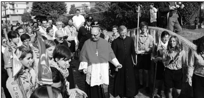
Mons. Fontana all'ingresso del Parco City accolto da una comunità festante.

È stato un ingresso molto partecipato quello del nuovo abate di Montichiari, mons. Gaetano Fontana! Ad attenderlo al parco City, domenica 19 settembre, oltre ad un folto gruppo di cittadini, erano presenti scouts, associazioni d'arma e di volontariato, rappresentanti del mondo sportivo, ragazzi dell'Oratorio ed attori del Café di Piocce e del Music-all, i quali si sono esibiti in alcuni pezzi del loro repertorio, quasi ad offrire al nuovo parroco una prima immagine della festosità dei monteclaresi. Un momento particolarmente toccante è stato l'incontro di mons. Gaetano con gli anziani genitori, giunti a Montichiari con i numerosi fe-