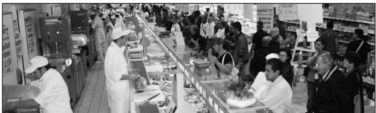
Grande interesse per le nuove proposte della ditta Robes.

Il nuovo punto vendita razionalmente organizzato e super moderno, con ampio parcheggio, si trova a Calcinato in via Rovadino 42/b.