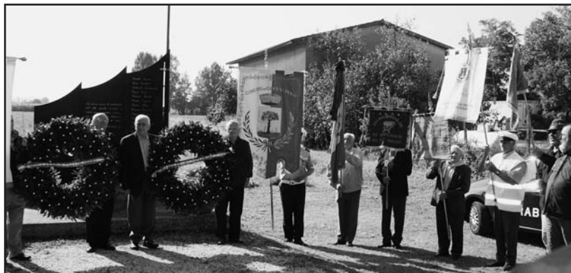
I labari delle Associazioni presenti alla cerimonia.